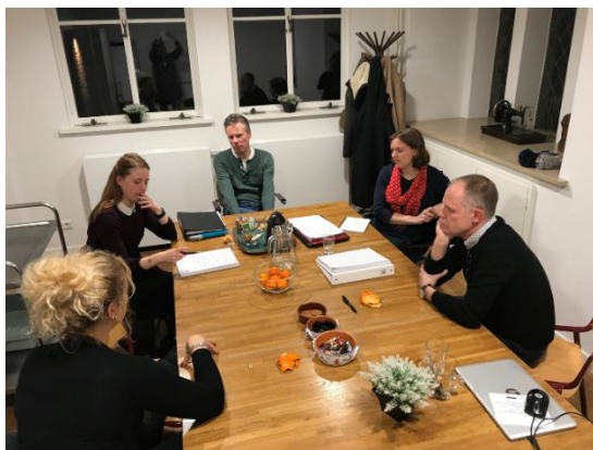
In gesprek met een deel van het bestuur.