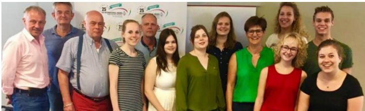
Kernteam Award NL