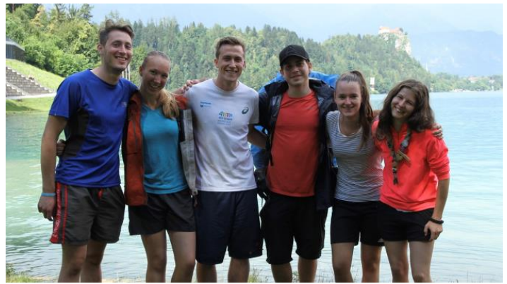
Twee deelnemster uit Nederland sluiten aan bij een Sloveense Expeditie groep.