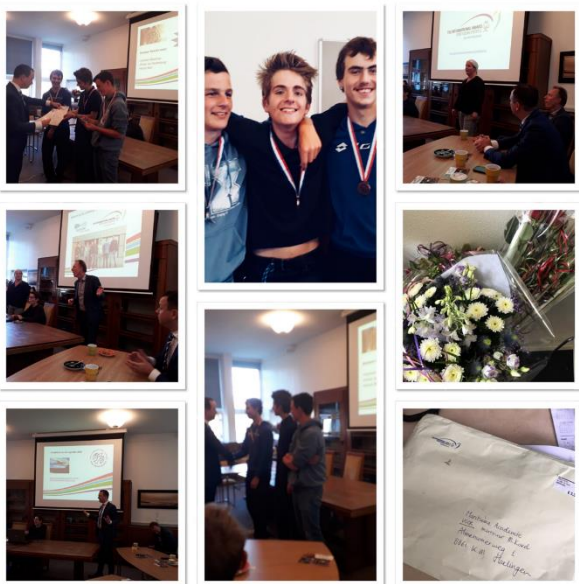
Bronzen Awards bij De Maritieme Academie in Harlingen.